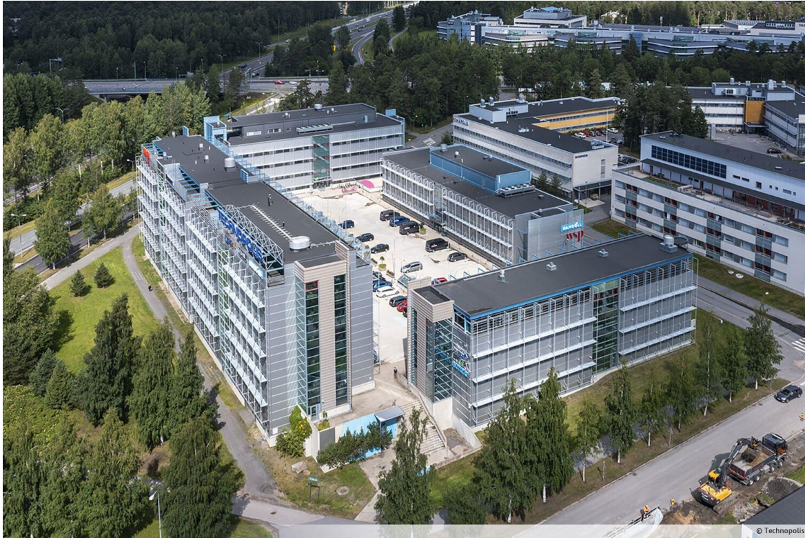
Oulun toimisto, Kiviharjunlenkki 1 E, 90220 Oulu