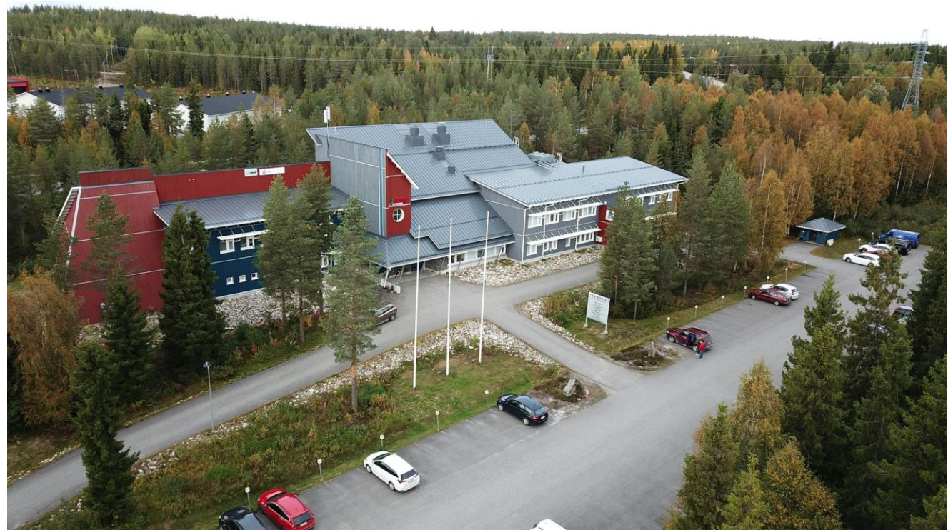
Rovaniemen toimisto Teknotie 14, 96930 Rovaniemi