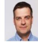
Mantila Pasi erikoisasiantuntija, käyttö Expert, Grid Operation